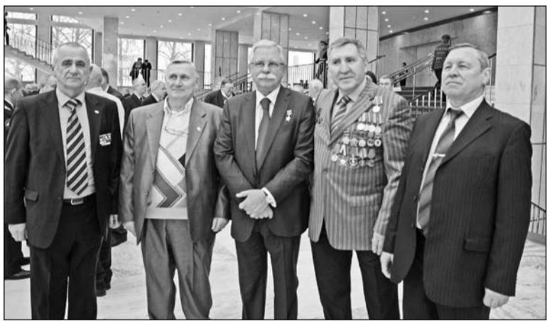
Делегация Республики Крым в Москве (Фото: Исаев И. Г.)